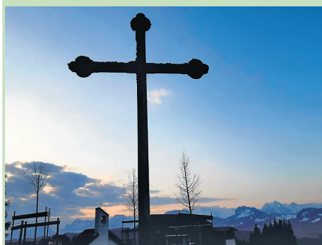
Ein Kreuz mit einer Weitsicht über den Bergen

Dieses Gebet betete der heilige Franziskus mit seinen Brüdern vor am Wegrand aufgestellten Kreuzen, in Kapellen und Kirchen und vor dem Tabernakel, dem besonderen Ort der leibhaften Gegenwart Christi in einer Kirche. Dieses Gebet beten darum auch die Franziskaner in deutsch oder lateinisch am Ende ihrer Gebetszeiten. Es erinnert uns daran, dass Christus immer hier und jetzt gegenwärtig ist und sich uns erlösend schenkt.